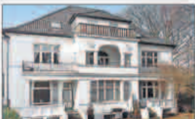
Villa in Kl. Borstel, Wohnfl. ca. 290 m² + DG, Gndst. ca. 928 m², € 980.000,-, ID-Nr. 1221065 Hamburg (D) • +49-(0)40-532 03 60