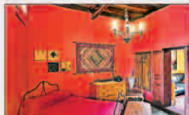
Rarität, UNESCO-Altbau v. Rhodos, Wohnfl. ca. 80 m², € 190.000,-, ID-Nr. W-00A4E4 Rhodos (GR) • +30-22410-794 10