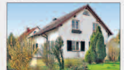
Landhaus, Wohnfl. ca. 160 m², Nutzfl. ca. 70 m², Gndst. ca. 478 m², € 230.000,-, ID-Nr. 1221526 Jena (D) • +49-(0)3641-23 26 40