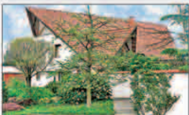
Architektenhaus, Wohnfl. ca. 311 m², Gndst. ca. 2.149 m², € 855.850,-, ID-Nr. 1214817 Krefeld (D) • +49-(0)2151-78 29 60