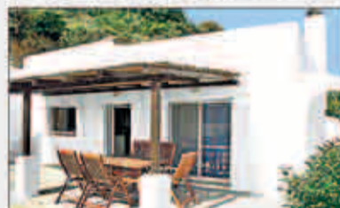
Repris. Ferienhaus, Wohnfl. ca. 100 m², Gndst. ca. 1.000 m², € 260.000,-, ID-Nr. W-00A4E4 Rhodos (GR) • +30-22410-794 10