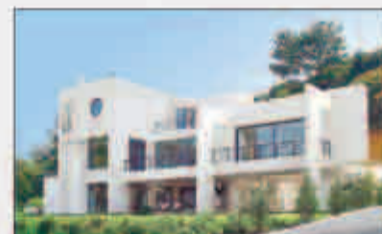
Architektenb. Panor. Meerblick, Wohnfl. ca. 460 m², Gndst. ca. 2008 m², € 1,25 Mio., ID-Nr. W-009NZ5 Rhodos (GR) • +30-22410-794 10