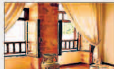
Charmantes Dorfhaus in Lindos, Wohnfl. ca. 120 m², € 430.000,-, ID-Nr. W-009O14 Rhodos (GR) • +30-22410-794 10

Rhodos • P&P Rhodes Real Estate E.P.E. Telefon +30-22410-794 10 • RhodosNorth@engelvoelkers.com www.evrhodos.com • Immobilienmakler