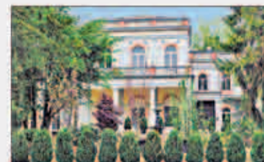
Elbville: historische Villa, 7 ETW, Wohnfl. 97-183 m², hochwert. saniert, ab € 357.790,-, ID-Nr. 1227977 Rheingau (D) • +49-(0)6123-70 90 60