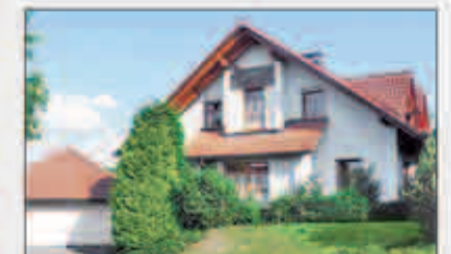
EHH, Wohnfl. ca. 210 m², Gndst. ca. 1.085 m², Wintergut, Kurort, € 440.000,-, ID-Nr. 1238083 Villingen-Schwen. (D) • +49-(0)721-4051 60

Zentrales Service-Telefon +49-(0)40-36 13 10 www.engelvoelkers.com • info@engelvoelkers.com Immobilienmakler