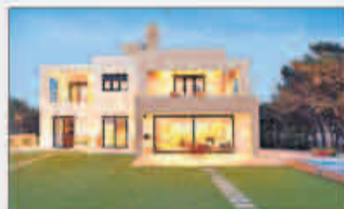
Exklusive Villa, Wohnfl. ca. 240 m², Gndst. ca. 2.080 m², € 1,0 Mio., ID-Nr. W-00A4EU Rhodos (GR) • +30-22410-794 10