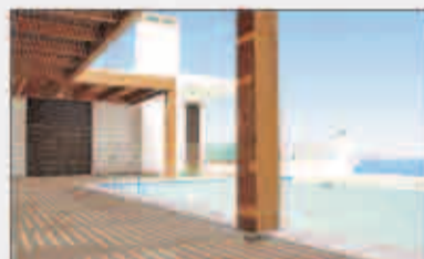
Attrakt. Tennishaus, Wohnfl. ca. 110 m², Gndst. ca. 320 m², € 315.000,-, ID-Nr. W-009NN9 Rhodos (GR) • +30-22410-794 10