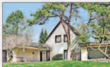
Klein. EHH, Top-Lage/Refits, Wohnfl. ca. 160 m², Gndst. ca. 1.100 m², € 570.000,-, ID-Nr. 1223133 Bergisch-Gladb. (D) • +49-(0)2204-76 75 20

Zentrales Service-Telefon +49-(0)40-36 13 10 www.engelvoelkers.com • info@engelvoelkers.com Immobilienmakler