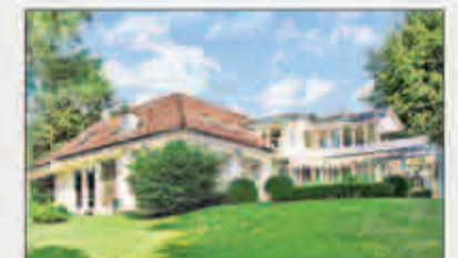
Exkl. Villa, Bestg. Top-Ausg., Wohnfl. ca. 530 m², Gndst. ca. 2.181 m², Preis a. Anfr., ID-Nr. 1165604 Siegburg (D) • +49-(0)2241-25 35 70