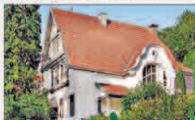
Villa, Höhenimb. a. Schlossbg., Wohnfl. ca. 182 m², Gndst. ca. 1.420 m², € 440.000,-, ID-Nr. 1200504 Witten-Herdecke (D) • +49-(0)2302-91 46 10