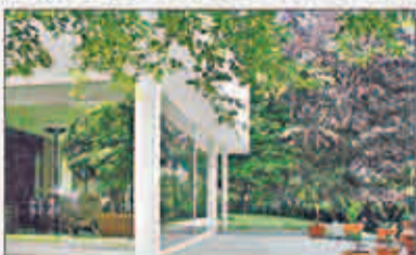
Exkl. Bungalow i. Alleenlage v. Bod. Oeynhausen, perfekte Anbindung, € 335.000,-, ID-Nr. 1219991 Minden (D) • +49 - (0)571-88 91 19 13