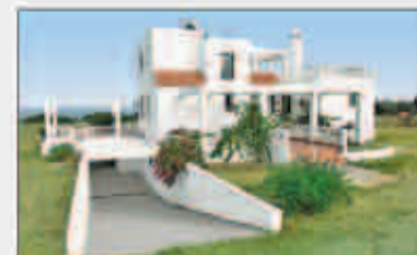
EHH in guter Lage, Wohnfl. ca. 320 m², Gndst. ca. 4.000 m², € 520.000,-, ID-Nr. W-009Z17 Rhodos (GR) • +30-22410-794 10