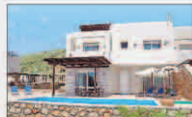
Mod. Ferienhaus m. Meerblick, Wohnfl. ca. 140 m², Gndst. ca. 900 m², € 360.000,-, ID-Nr. W-00A48F Rhodos (GR) • +30-22410-794 10