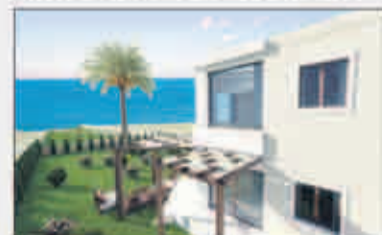
Top-Design Pool, strandnah, Wohnfl. ca. 160 m², Gndst. ca. 800 m², € 550.000,-, ID-Nr. W-009PF1 Rhodos (GR) • +30-22410-794 10