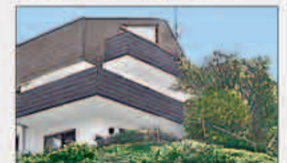
EHH, Aussichts. v. Feuerbach, Wohnfl. ca. 179 m², Gndst. ca. 635 m², € 549.000,-, ID-Nr. 1227345 Stuttgart (D) • + 49-(0)711-227 24 70